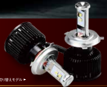
写真はハイロー切り替えモデル▶